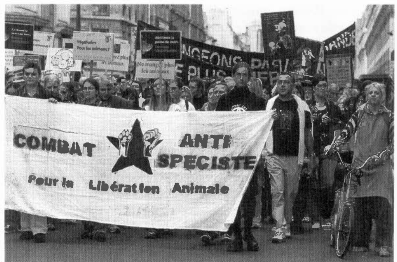
1. Groupe antispéciste participant à la Veggie Pride (Fête de la fierté végétarienne) du 19 mai 2007 à Paris.